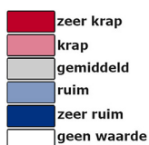
Afbeelding 2: Spanningsindicator Nederland 4e kwartaal 2023